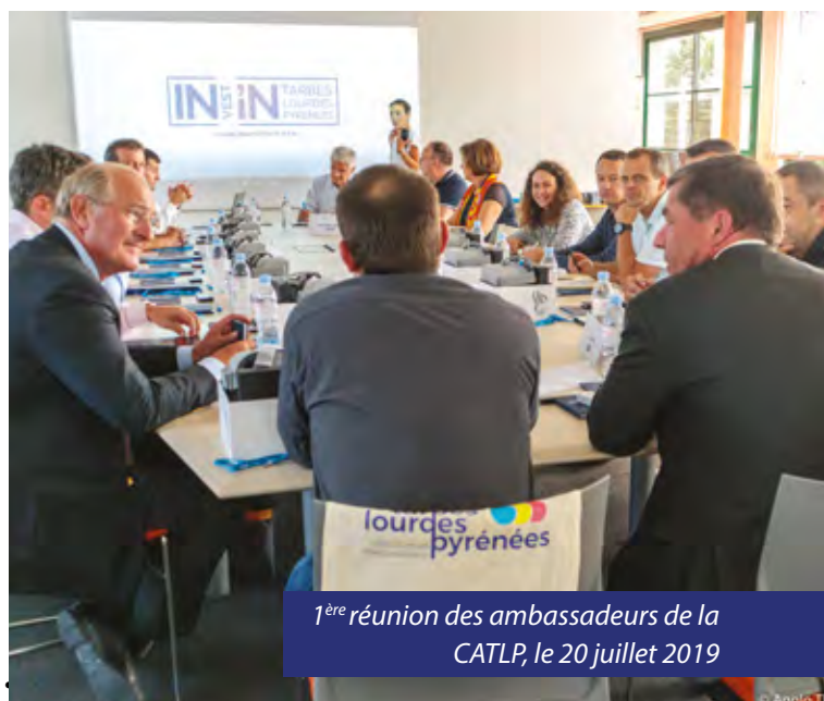
1 ère réunion des ambassadeurs de la CATLP, le 20 juillet 2019