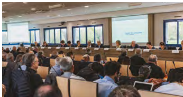
Engagement du Diagnostic/Enjeux du territoire de la Communauté d'Agglomération

En novembre, 3 rencontres territoriales sectorielles avec les élus ont permis de partager le fonctionnement des territoires dans l'agglomération et d'éclairer ainsi le Diagnostic.