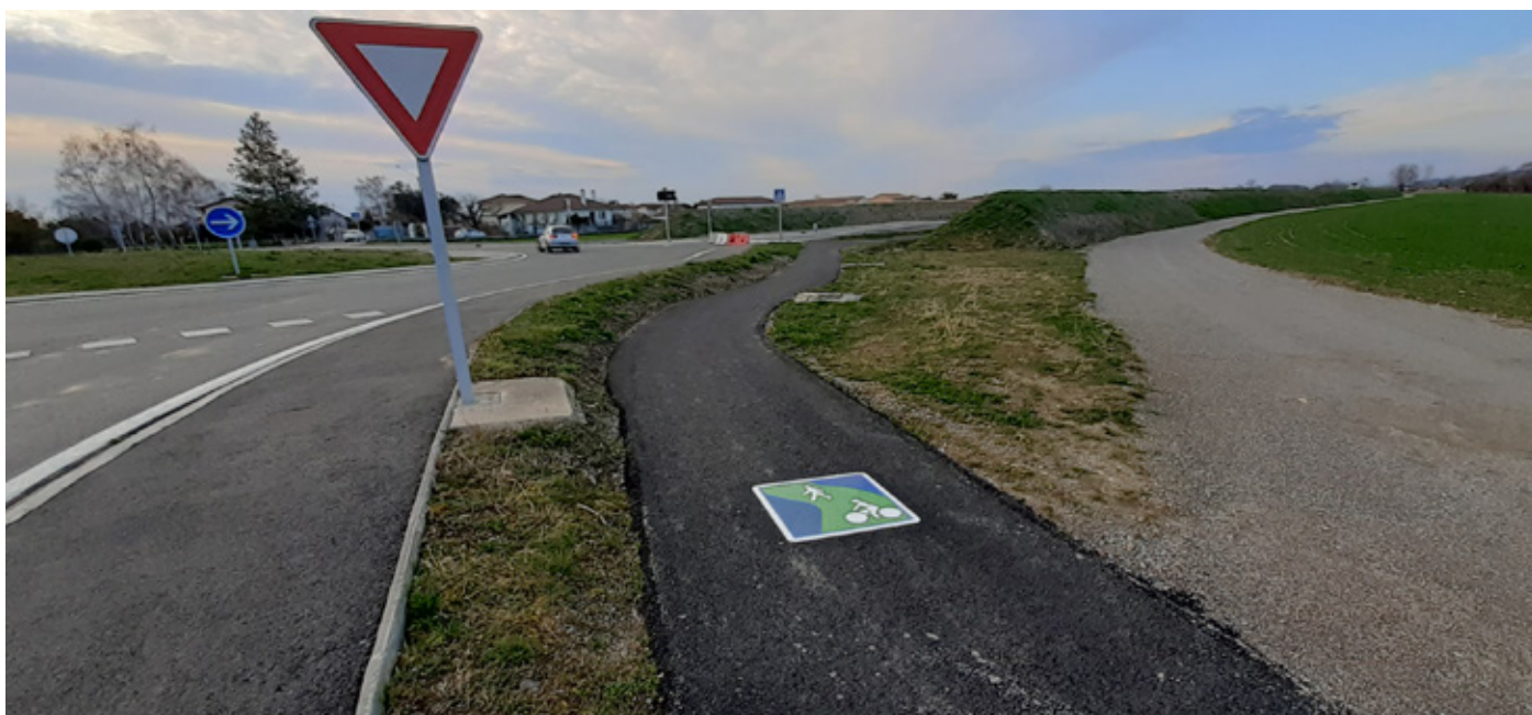
Voies vertes de la RD8 (Barbazan-Debat)

Les plans locaux d'urbanisme sont des outils de planification territoriale pouvant contribuer à développer les infrastructures utiles à la pratique du vélo, en définissant des emplacements réservés pour les aménagements cyclables, ou en rendant obligatoire des équipements de stationnement vélo pour les constructions nouvelles. En concertation avec les communes et les services compétents, les documents de planification devront ainsi mieux intégrer la thématique du vélo et des mobilités douces.