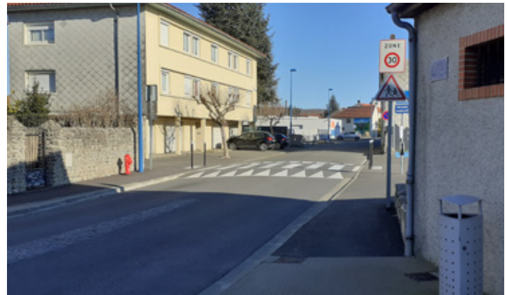
Gauche : SAS vélo à la place du Champ Commun (Lourdes) ; Droite : Zone 30 à la rue Jules Guesde (Aureilhan)

Grâce à la mobilisation des communes, ce maillage connecté au réseau structurant permettra une cohabitation sécurisée des vélos avec les autres modes (véhicules motorisés, piétons...) avec des aménagements adaptés :