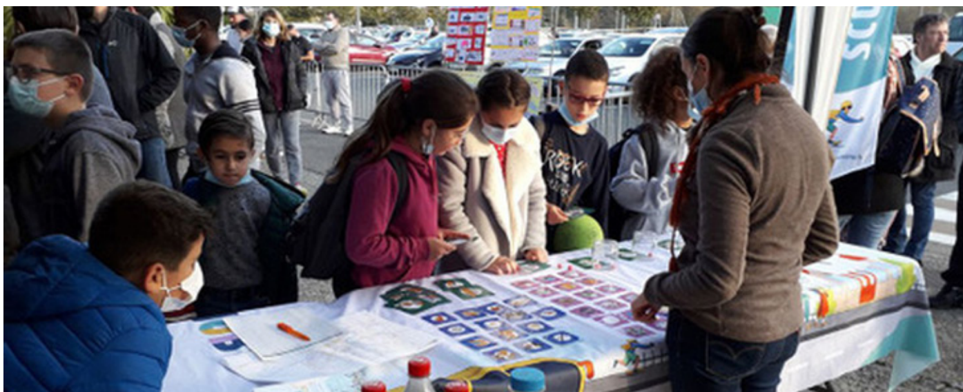
Ateliers Moby à l'école de Bordères-sur-L'Échez

Des dispositifs existent pour permettre aux employeurs d'encourager et d'accompagner leurs salariés vers l'écomobilité, comme le forfait mobilité durable (FMD), la mise à disposition de parkings vélo et de douches ou encore l'organisation de challenges d'activités. La CATLP informe et guide les employeurs pour leur mise en œuvre, et sur les programmes d'aide existants comme l'Objectif Employeur Pro-Vélo.