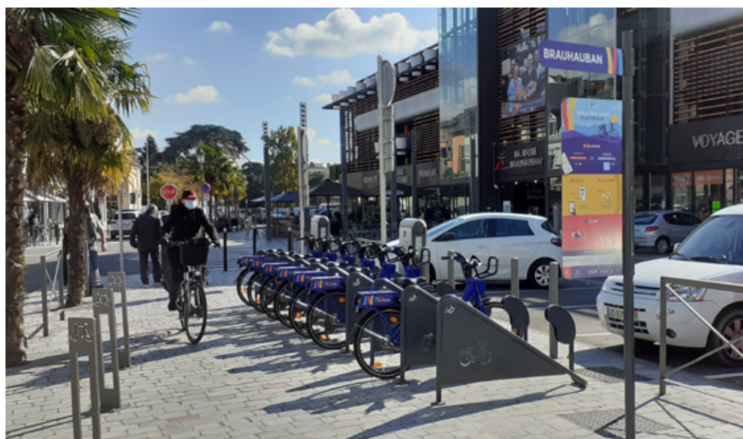
Station VLS TLP Mobilités de Brauhauban (Tarbes)

En octobre 2020, le réseau de transports urbains TLP Mobilités a été inauguré, intégrant un nouveau système de location de vélos en libre-service. Aujourd'hui, 9 stations de vélos en libre-service (5 à Tarbes, 4 à Lourdes) et 50 vélos à assistance électrique sont déployés. Après une première année marquée par la crise sanitaire, le service compte aujourd'hui près de 1000 utilisations mensuelles.