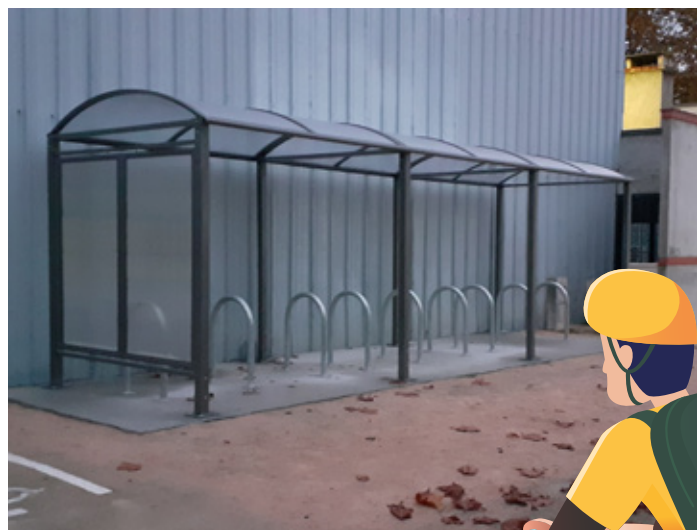
Gauche : Consigne vélo au pôle universitaire (Tarbes) ; Droite : Arceaux abrités (Odos)

D'autres motifs de déplacement nécessitent cependant des durées de stationnement plus longues, et des niveaux de sécurité plus élevés, pour aller au travail ou dans un lieu d'études par exemple.