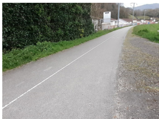
Gauche : piste cyclable de l'ENIT (Tarbes) ; Droite : Voie verte des Gaves (Lourdes)

Le réseau est structuré en trois niveaux :