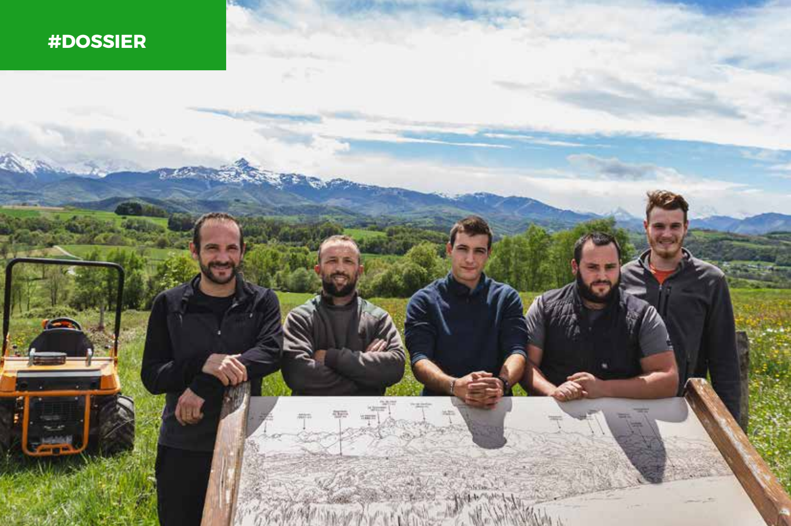
Une partie de l'équipe Brigade Bleue