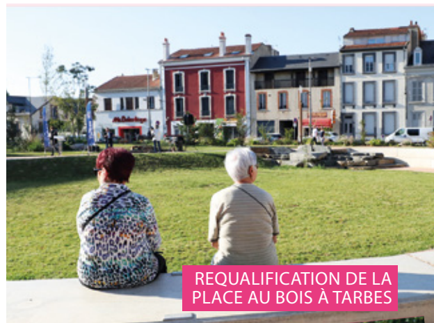
REQUALIFICATION DE LA PLACE AU BOIS À TARBES