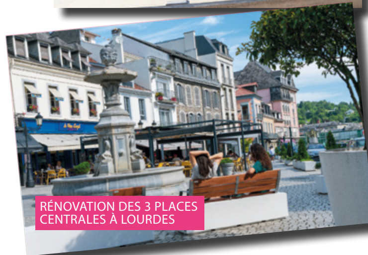
RÉNOVATION DES 3 PLACES CENTRALES À LOURDES

À ce jour, le montant global des 50 actions prévues sur Tarbes et Lourdes approche les 20M€, dont 42,5 % de financement par l'État.