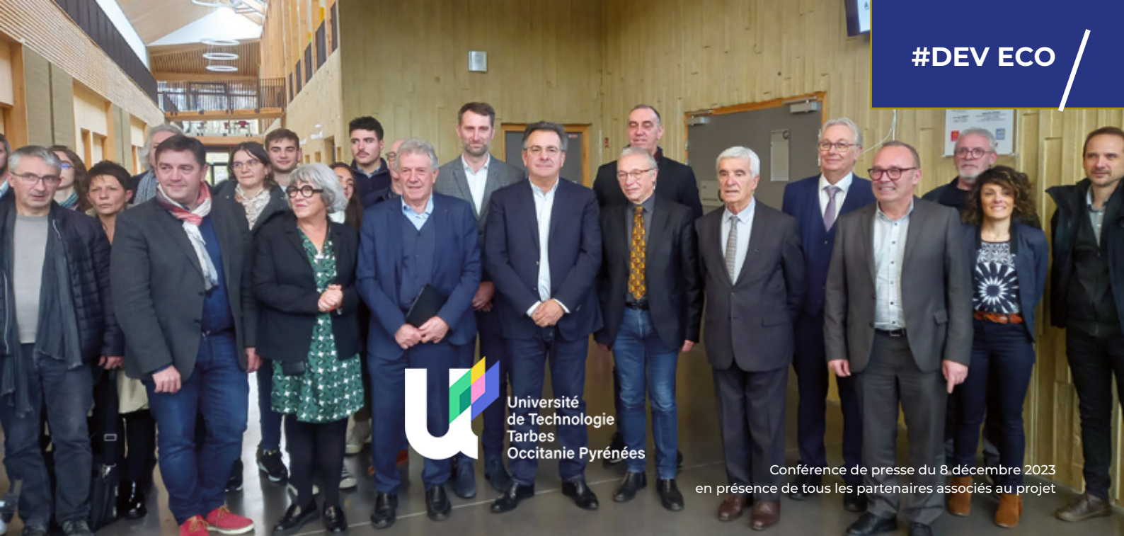
Conférence de presse du 8 décembre 2023 en présence de tous les partenaires associés au projet